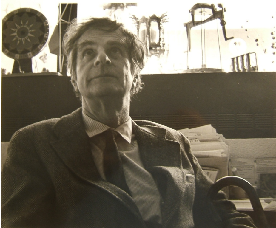
Nicolas Calas

Αθήνα, 17-18 Ιουνίου 2016 Ανωτάτη Σχολή Καλών Τεχνών